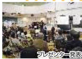
プレゼンター発表