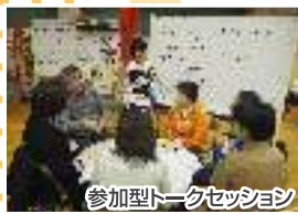
参加型トークセッション