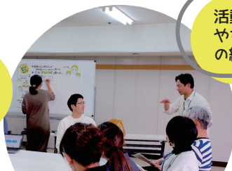
まつどみらいカイギでは対話の様子をグラレコにしています

言葉だけでは分かりにくい団体のビジョンやモヤモヤする課題を、図解でスッキリ構造化！